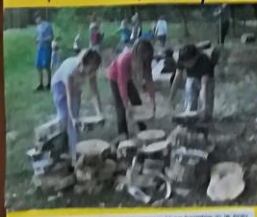
Šola mora biti mesto, kjer se učenci učijo, razvijajo in pridobivajo nove veščine. Šola mora biti mesto, kjer se učenci učijo, razvijajo in pridobivajo nove veščine.