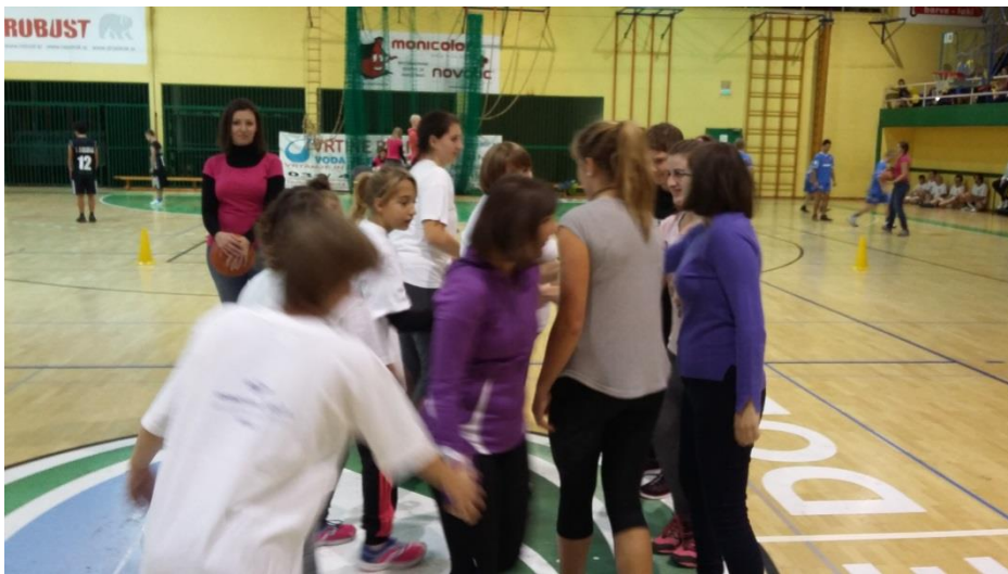
Pozdrav nasprotni ekipi.

Z ozirom na poslane rezultate so nas uvrstili v skupino 1, v kateri so bile še štiri ekipe. Po odigranih štirih tekmah smo osvojili drugo mesto. Dekleta so sijala od zadovoljstva, obe spremljevalki pa prav tako. In kot vedno – športno srečanje je ponudilo tudi kulturni utrinek s programom iz sveta glasbe, športa in plesa ter obilo prilik za poglobljanje starih znanstev, sklepanje novih prijateljstev in prižiganje iskric v očeh. Lepo je biti in čutiti, da si del te velike družine – del Specialne olimpijade Slovenije.